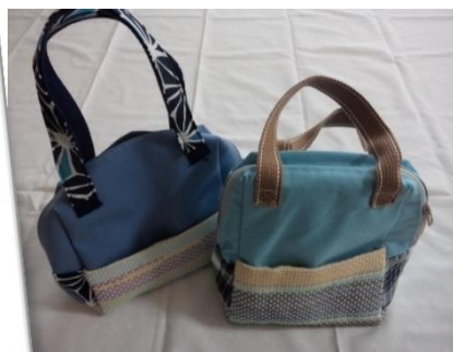
ゆうたさんの手づくりグッズ