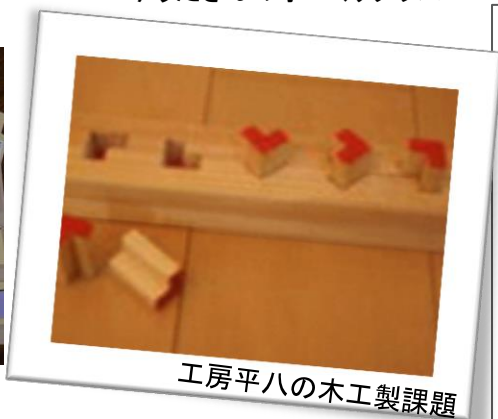
工房平八の木工製課題