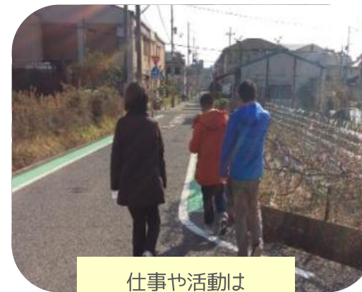
仕事や活動は 集中できる環境で