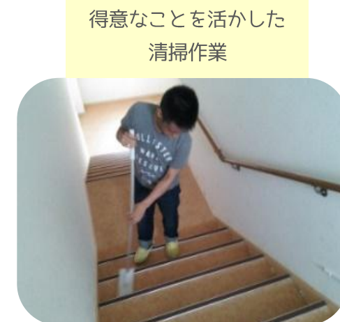
得意なことを活かした 清掃作業