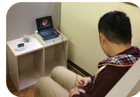
休憩ではリラックス♪