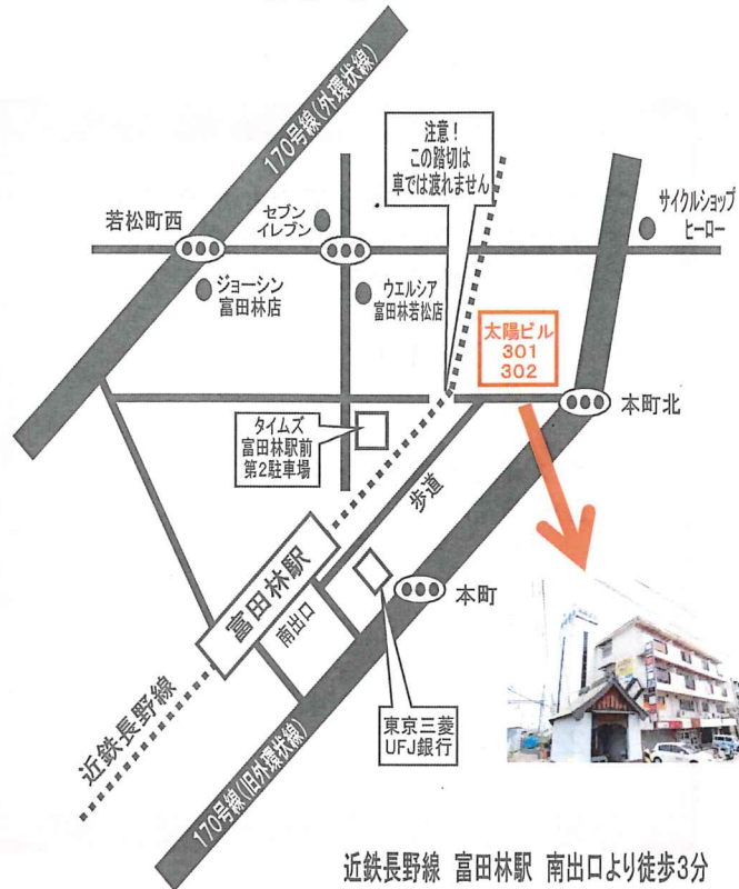
近鉄長野線 富田林駅 南出口より徒歩3分